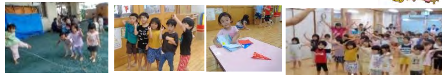
折り紙で作った紙飛行機飛ばしに夢中になることも達成

製作になると真剣ムードで取り組む子ども達。ハサミやのりを使っての製作では、切り貼りもどんどん上達しているのですが、終わった後の片付けの仕方もうまくなってびっくり！子ども達は「できるよ」と自信満々の表情で嬉しそうに伝えてくれます。