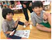
お友達と 楽しく遊 んでいま す♪