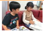
まちなと児童センター での様子😊