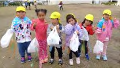
たごあげ しました♪