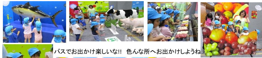
バスでお出かけ楽しいな!! 色んな所へお出かけしようね