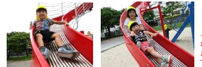
真志喜児童公園 行ったよ!