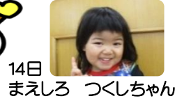
14日 まえしろ つくしちゃん