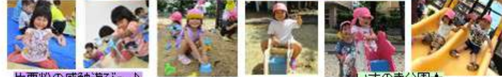
片栗粉の感触遊び~♪