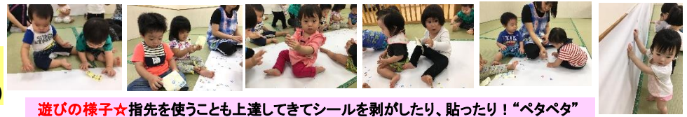
遊びの様子★指先を使うことも上達してきてシールを剥がしたり、貼ったり！「ペタペタ」