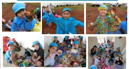
おべんとうおいしかった♡