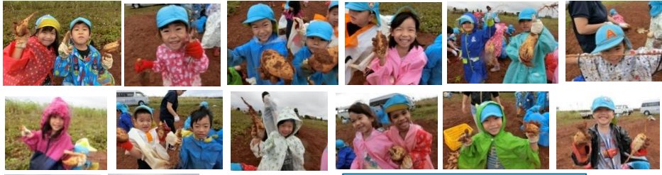
みんなでたくさんおもとったよ♪