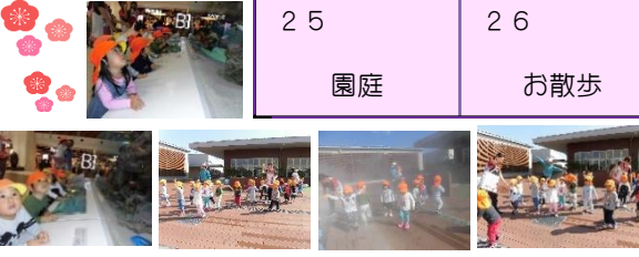
ライカムの屋上でおおはしゃぎー！！ありの～ままの～♪